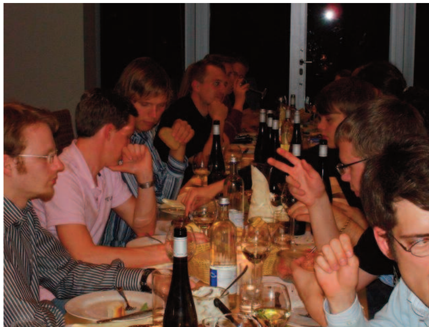
Auch das gehört zum Seminar: fröhliches Beisammensein nach getaner Arbeit