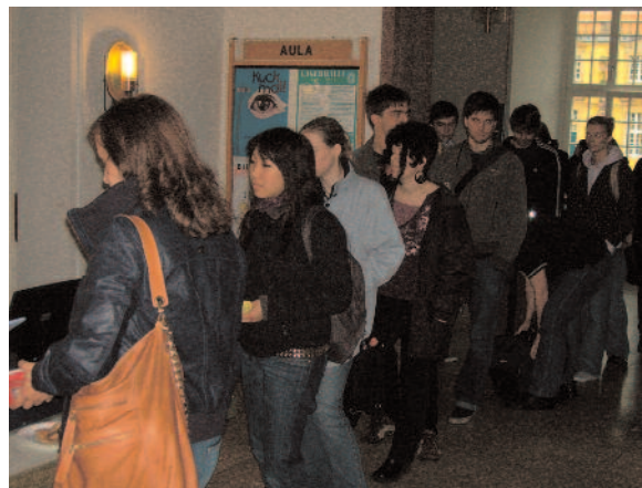
Riesen Erfolg: LHG-Studi-Blutspende-Aktion

Das Deutsche Rote Kreuz (DRK) und die Liberale Hochschulgruppe (LHG) freuen sich einmal mehr über eine gelungene Universitätsblutspende. Trotz des regnerischen Wetters fanden 180 Spender den Weg ins Osnabrücker Schloss. „Mit dem Anteil von über 30% Erstspendern sind wir hoch zu-